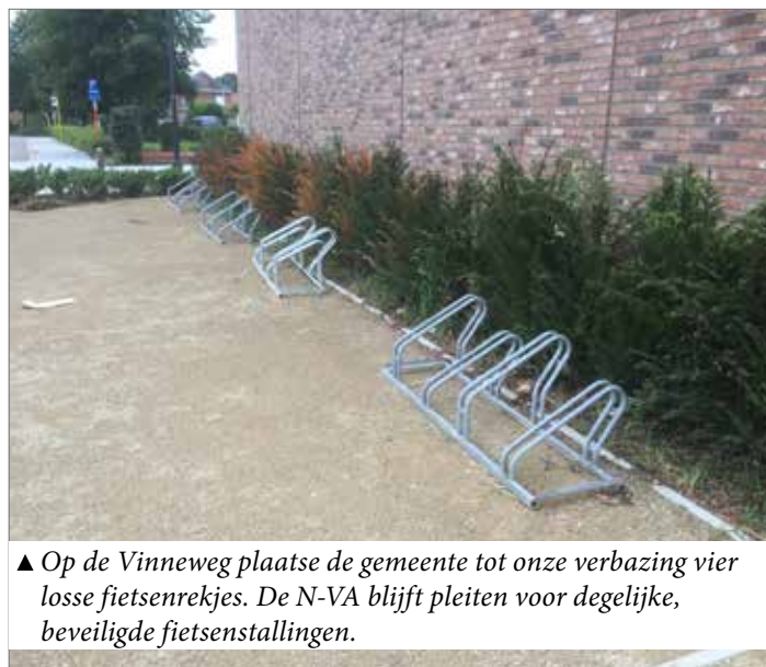
▲ Op de Vinneweg plaatste de gemeente tot onze verbazing vier losse fietsenrekjes. De N-VA blijft pleiten voor degelijke, beveiligde fietsenstallingen.

Spijtig genoeg keurde de meerderheid ons voorstel niet goed. Tot onze verbazing kwamen er na onze vraag wel vier losse fietsenrekjes op de Vinneweg, maar dat is niet wat onze inwoners verwachten.