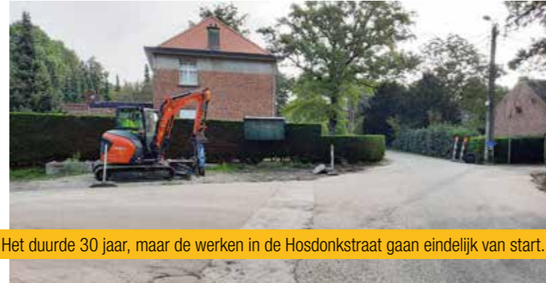
Het duurde 30 jaar, maar de werken in de Honsdonkstraat gaan eindelijk van start.

Het rioleringswater van de Honsdonkstraat zal naar de waterzuiveringsinstallatie van Rotselaar afgevoerd worden. Door de nieuwe norm bij het uitvoeren van rioleringswerken, blijft het hemelwater ter plaatse. Zo komt er geen verontreiniging meer in het nabijgelegen trilveengebied.