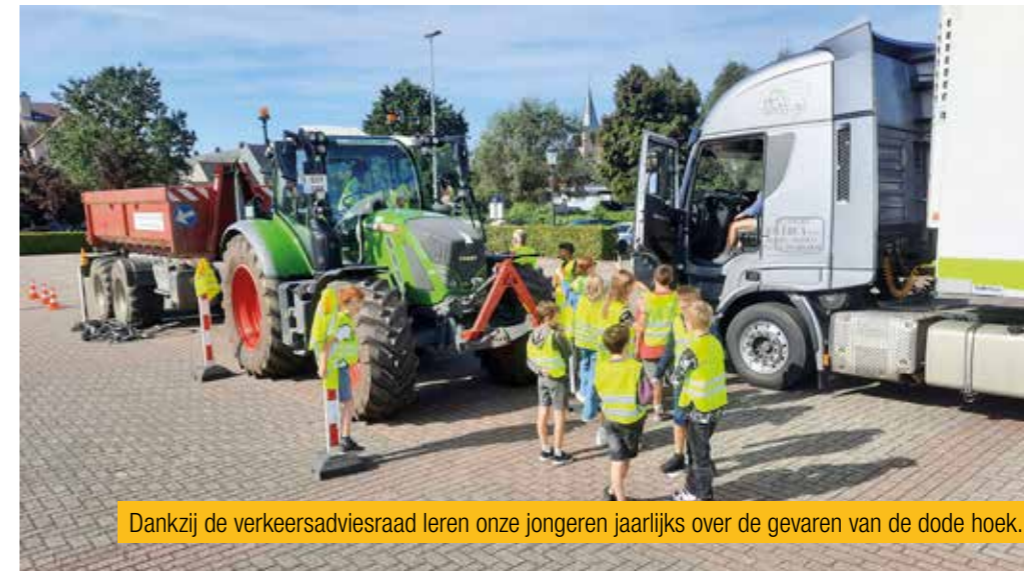
Dankzij de verkeersadviesraad leren onze jongeren jaarlijks over de gevaren van de dode hoek.

De verkeersadviesraad organiseert al vijf jaar de week van de dode hoek. Tijdens die week krijgen scholieren uit onze gemeente (en andere geïnteresseerden) de kans om gratis een informatiesessie te volgen over de gevaren van de dode hoek.