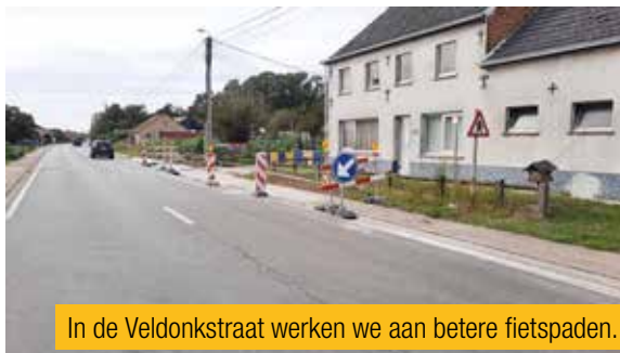
In de Veldonkstraat werken we aan betere fietspaden.